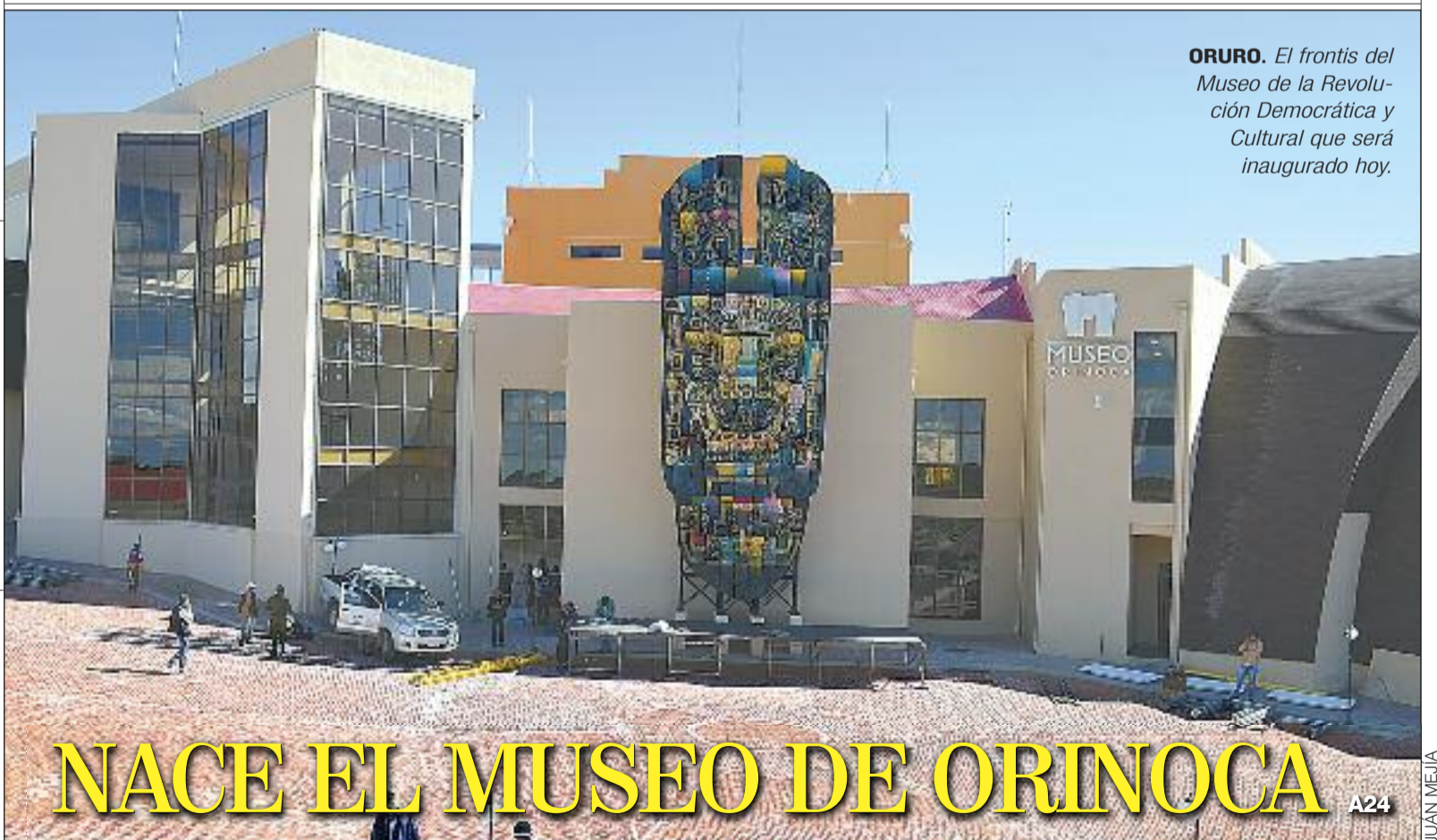
ORURO. El frontis del Museo de la Revolución Democrática y Cultural que será inaugurado hoy.

■ Desde ayer rige el endurecimiento del control migratorio a Argentina. Personal boliviano de Migración reveló que en La Quiaca, frontera con Villazón (Potosí), el sistema es aplicado por sus pares del vecino país, pero sin acceso a la base de datos de Bolivia, ya que Argentina incumplió un acuerdo. A18 Y A30