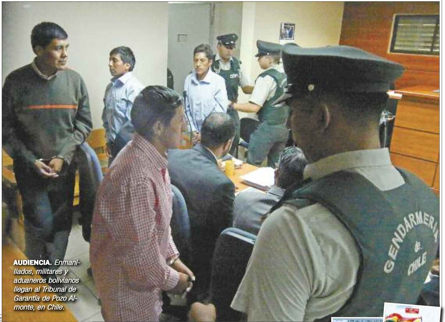
AUDIENCIA. Enmanillados, militares y aduaneros bolivianos llegan al Tribunal de Garantía de Pozo Almonte, en Chile.