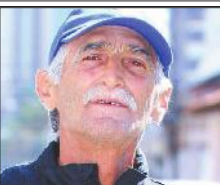
MARTINS PADRE SUGIERE AL DT QUE PIDA DISCULPAS A JUGADORES