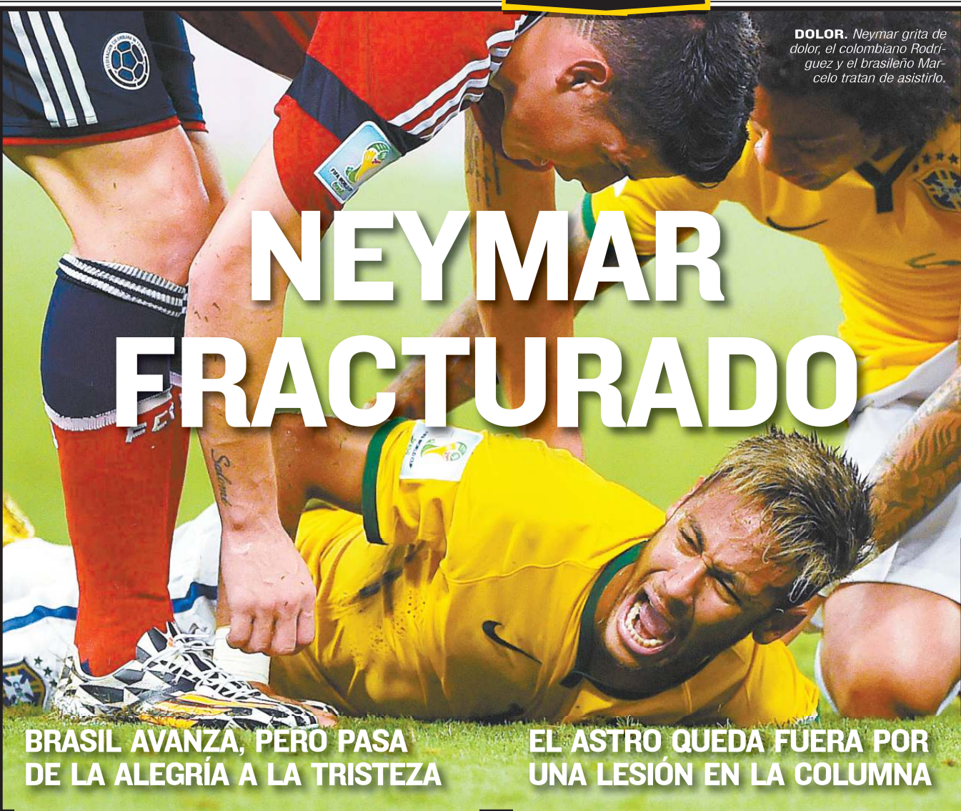
DOLOR. Neymar grita de dolor, el colombiano Rodríguez y el brasileño Marcelo tratan de asistirlo.

FRANCIA 0-ALEMANIA 1 • BRASIL 2-COLOMBIA 1