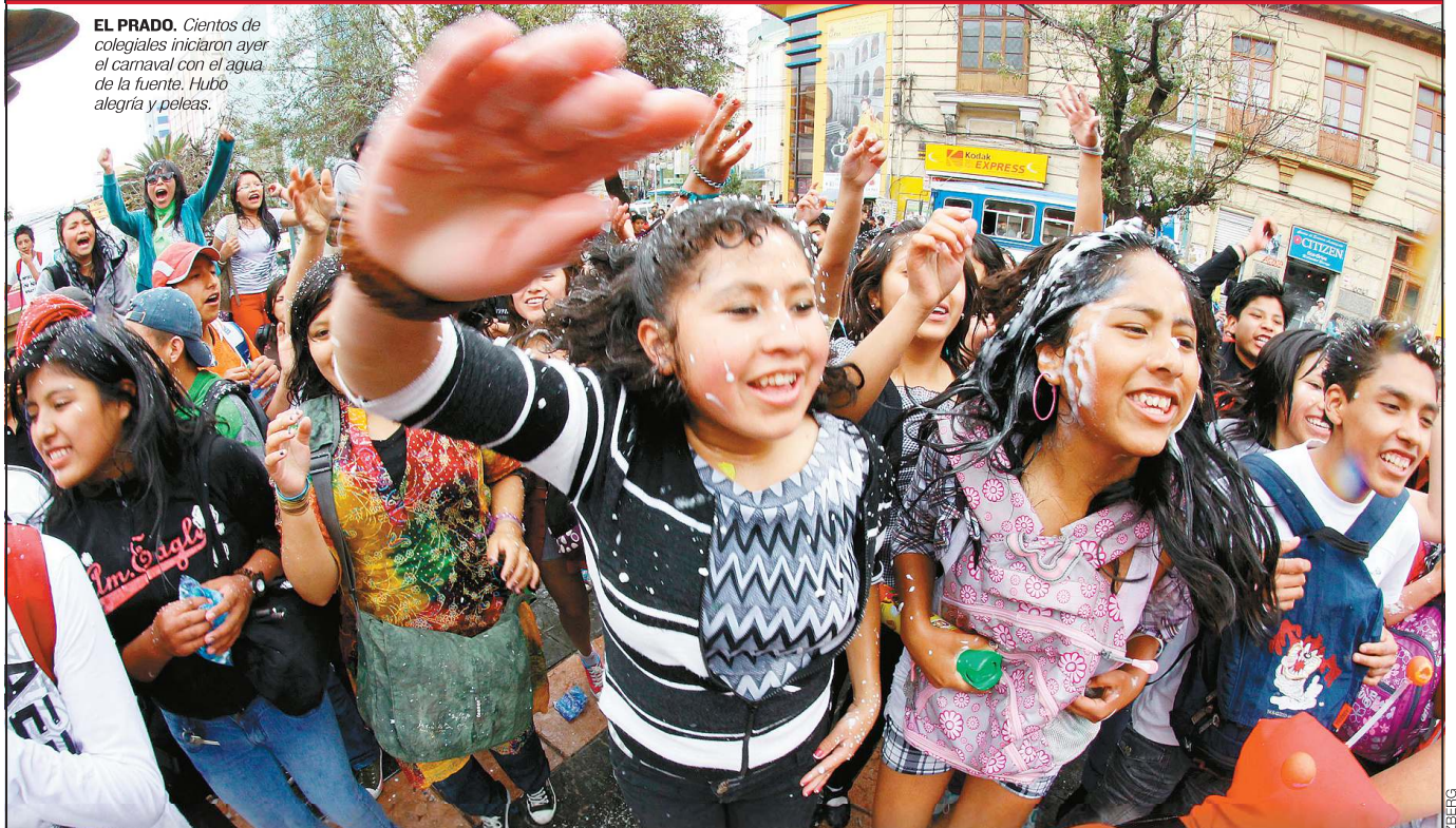
EL PRADO. Cientos de colegiales iniciaron ayer el carnaval con el agua de la fuente. Hubo alegría y peleas.