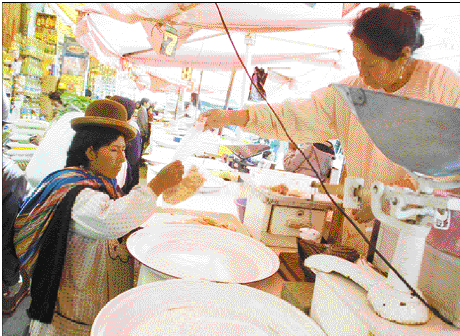
MERCADO RODRÍGUEZ • Varios puestos de venta de pollo estaban vacíos ayer. Los precios de la carne de vaca se elevaron.

La misma desolación se pudo percibir en los mercados, donde en un día clave como es el sábado hubo especulación de precios. El kilo de pollo, que hasta ayer costaba entre 8 y 8,50 bolivianos, se vendió hasta en 15 bolivianos.