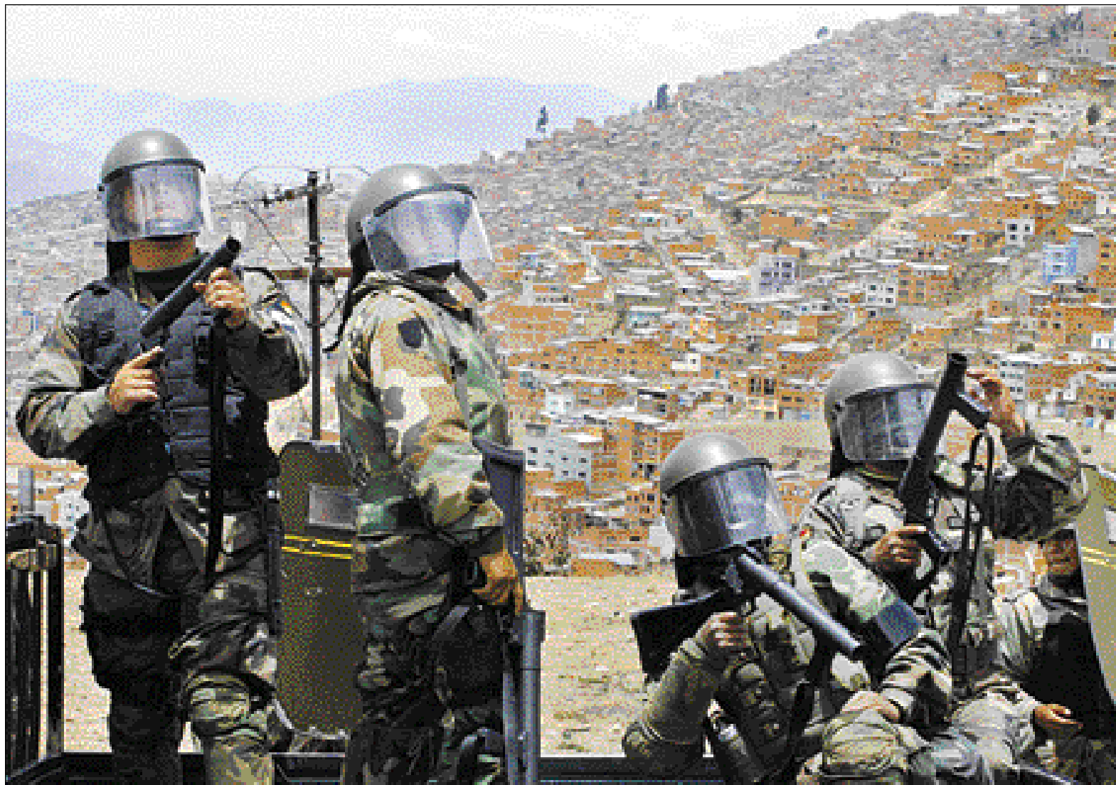
DESDE LA PAZ • Un grupo de policías antimotines, parapetados en La Portada, responde a vecinos de la zona Ballivián, El Alto.