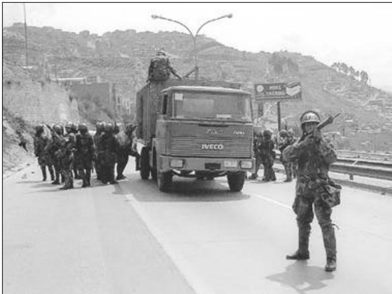
RESGUARDO • Desde tempranas horas del sábado los policías y militares se apostaron en la carretera hacia la urbe alteña.