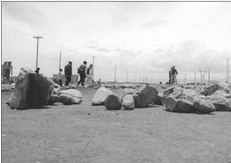
BLOQUEO • Este es el panorama cerca a Senkata. En el sur, norte y centro de El Alto la circulación está igual de impedida.