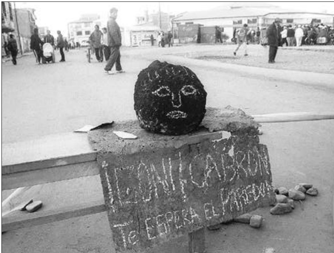
EXPRESIÓN POPULAR • En la avenida Juan Pablo II, sobre los bancos de una escuela que bloquean la vía, la gente demuestra su enojo con un mensaje dirigido al Poder Ejecutivo.

Aseguró que el Jefe de Estado quiere encontrar salidas urgentes a la actual tensión social, pero que no está dispuesto a renunciar, ni a hablar de constituyente o referéndum porque no son constitucionales.