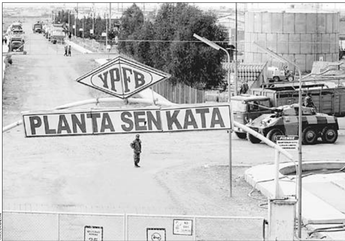
LA PLANTA SENKATA • En la parte superior de la foto se observa algunos camiones cisterna con el combustible que la población de La Paz esperaba comprar hoy. Aún no podrá hacerlo.