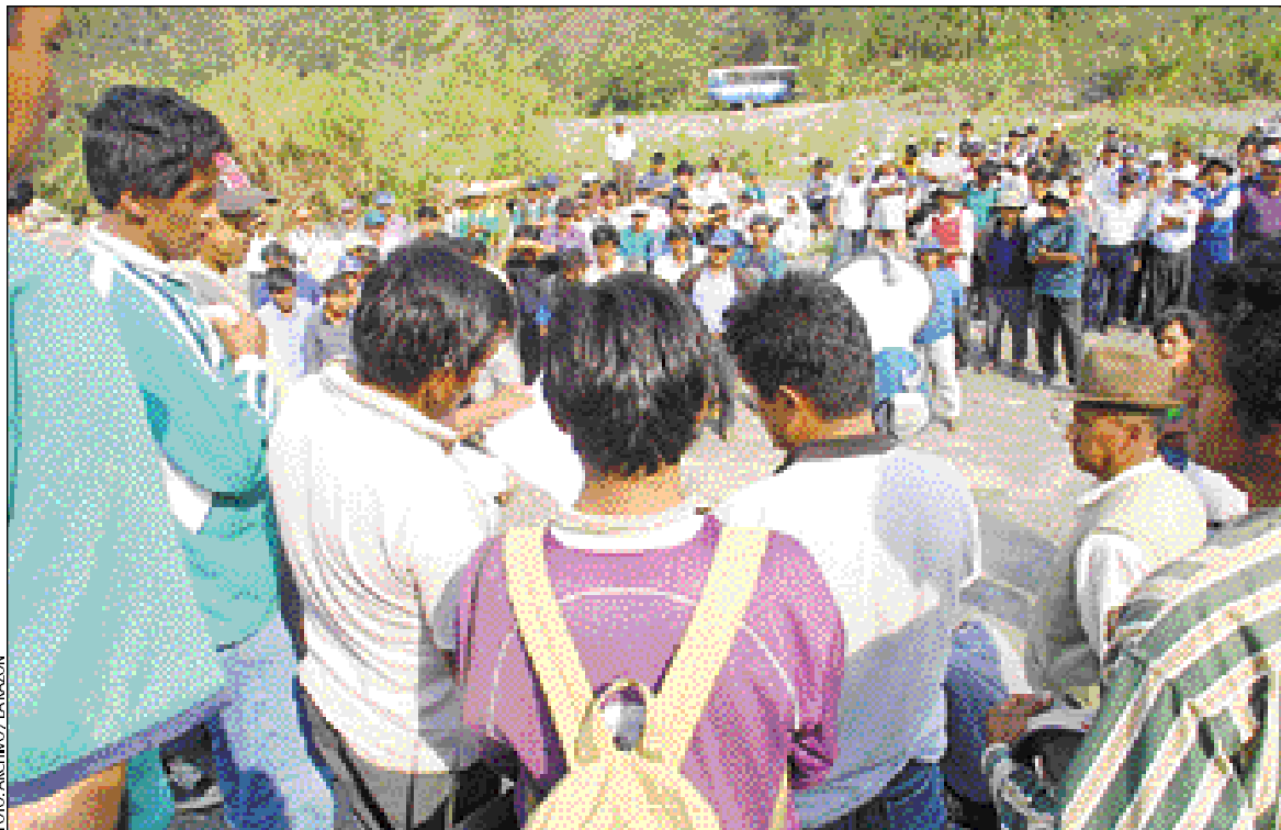
NOR YUNGAS, BLOQUEADO • Un mitin de cocaleros de Adepcoca decide sus medidas de presión. "La fruta se está pudriendo", aseguró un dirigente. Van siete días de protesta.

El dirigente fabril Óscar Olivera informó que las movilizaciones se iniciarán con los estudiantes de la Universidad Mayor de San Simón y los fabriles. El martes se sumarán a la protesta los transportistas y se procederá a realizar bloqueos, marchas y un desfile de teas en la noche. El miércoles, en todas las calles y avenidas se procederá al bloqueo general de la ciudad