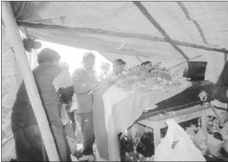
VELATORIO • El ataúd del minero está en la carretera. La gente logró recaudar algo de dinero para colaborar a la viuda.