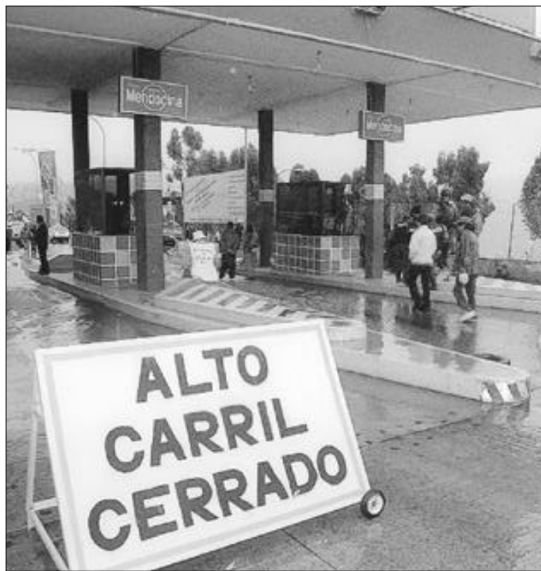
POCO TRÁNSITO • En el cuarto día de paro en El Alto, la circulación por la autopista La Paz-El Alto fue restringida.

RECORRIDO • Dos horas tardaron tres camiones con el carburante que viajaron escoltados por tanquetas. El combustible era para las FFAA.