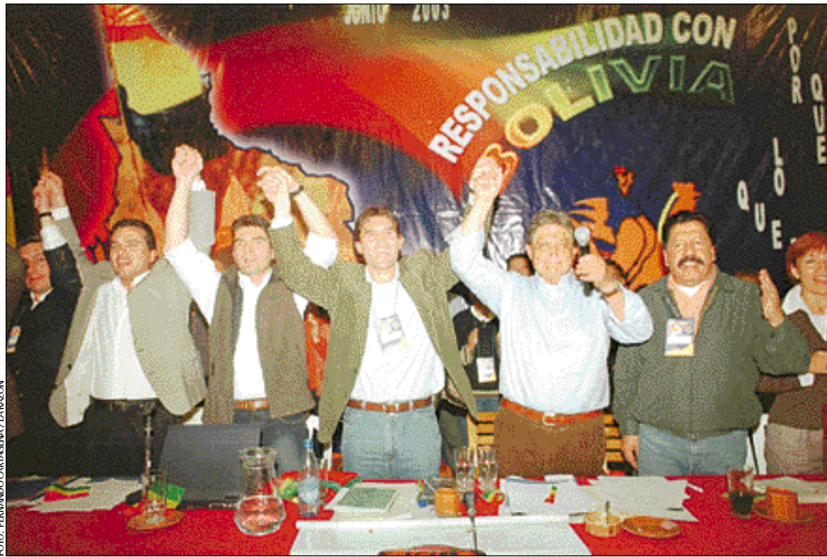
EL PRINCIPIO DE LA DISCORDIA • El 27 de junio (foto), el MIR se reunió en un congreso en Santa Cruz para aprobar sus estatutos y definir su democratización, la que aún no sucede.