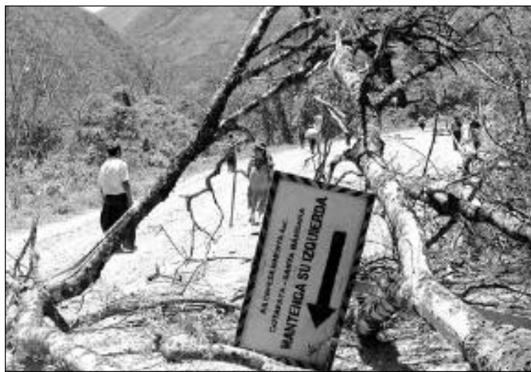
EL BLOQUEO EN YOLOSIILLA • Varias ramas, decenas de piedras y parte de un letrero caminero cortaron el paso.