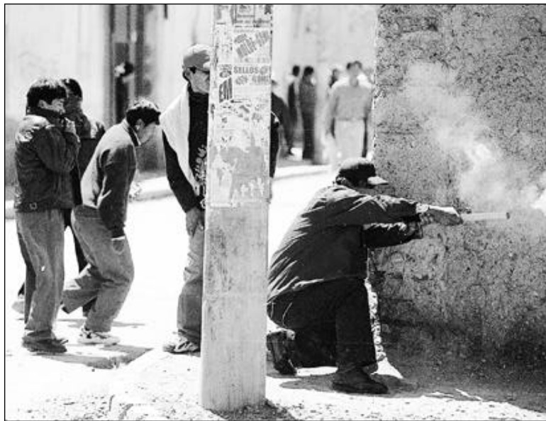
DURO ENFRENTAMIENTO • Alumnos de la Universidad Pública de El Alto contrarrestan los gases con petardos.

reportes de otras zonas de El Alto sobre nuevos enfrentamientos en la carretera a Viacha, cerca al cruce de Villa Adela, y en Ventilla, camino a Oruro, donde otros dos ciudadanos fueron heridos con balines cuando bloqueaban.