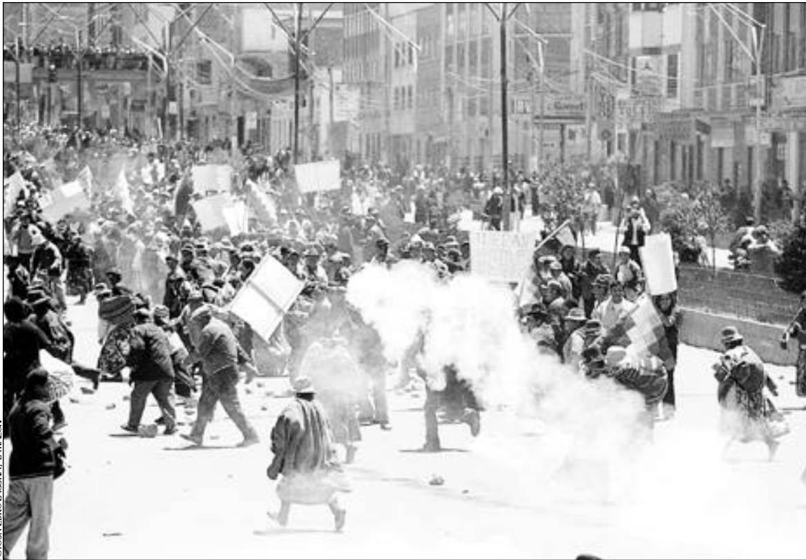
CONFRONTACIÓN • Comunarios de Zongo son reprimidos por los militares cuando se encontraban en la avenida 6 de Marzo. Los estudiantes de la UPEA provocaron la violencia.