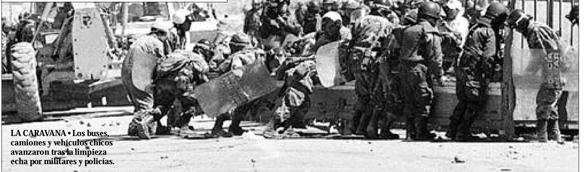
LA CARAVANA • Los buses, camiones y vehículos chicos avanzaron tras la limpieza hecha por militares y policías.

El segundo día de paro cívico de El Alto se degradó por los combates entre mineros de Huanuni y uniformados. Ventilla fue el escenario donde hubo 21 heridos. Un convoy tardó horas en llegar hasta La Paz.