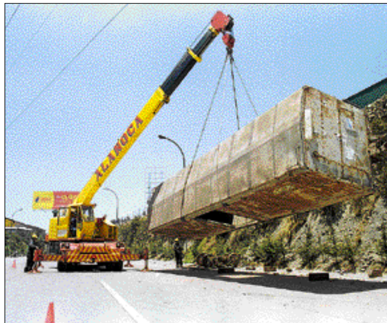
FUERZA MECÁNICA • Una grúa de la empresa Alanoca alza uno de los vagones que pesa 10 toneladas aproximadamente.

Los vecinos indicaron que no fue difícil empujar los vagones, pues se encontraban sobre los rieles. Hubo peligro al empujarlos sobre la autopista, ya que un mal movimiento pudo hacer que muchos queden aplastados. Alanoca dijo que cada vagón pesa 10 toneladas y los boguis, cuatro. El trabajo se realizó a pedido de la empresa Socaire Bolivia.