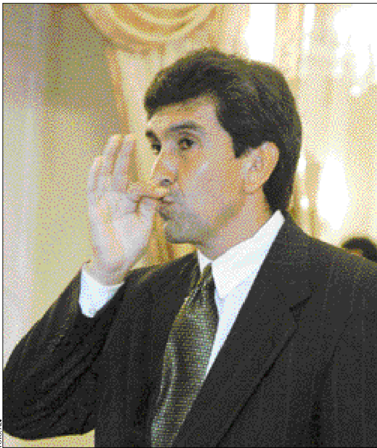
JURAMENTO Y DESAFÍOS • Álvaro Ríos besa la señal de la cruz en su posesión realizada anoche en Palacio de Gobierno.

La autoridad agregó que la información sobre el tema del gas será transparente para que los bolivianos sientan que los hidrocarburos "pueden convertirse en una locomotora del desarrollo del país en el corto, mediano y largo plazo".