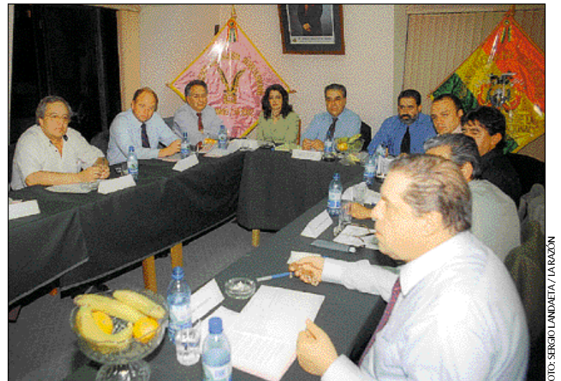
REUNIÓN TRAS LA CAÍDA DE GONI • Miembros del CEN del MNR (foto) se reunieron ayer en su sede de la calle Aspiazu.

El MNR, tras la renuncia de Sánchez de Lozada a la presidencia y la asunción de Mesa, ya tomó posición respecto al nuevo Gobierno. Dijo que está fuera de él y que apoyará lo que sea constructivo para el país y criticará lo malo. Esa posición fue ratificada ayer por Durán, quien dijo que la caída de Sánchez de Lozada se produjo por la irresuelta crisis económica. Además, señaló que hay que tomar acciones para no perder la democracia y habló de cambios en los partidos para recuperar la confianza de las clases populares.