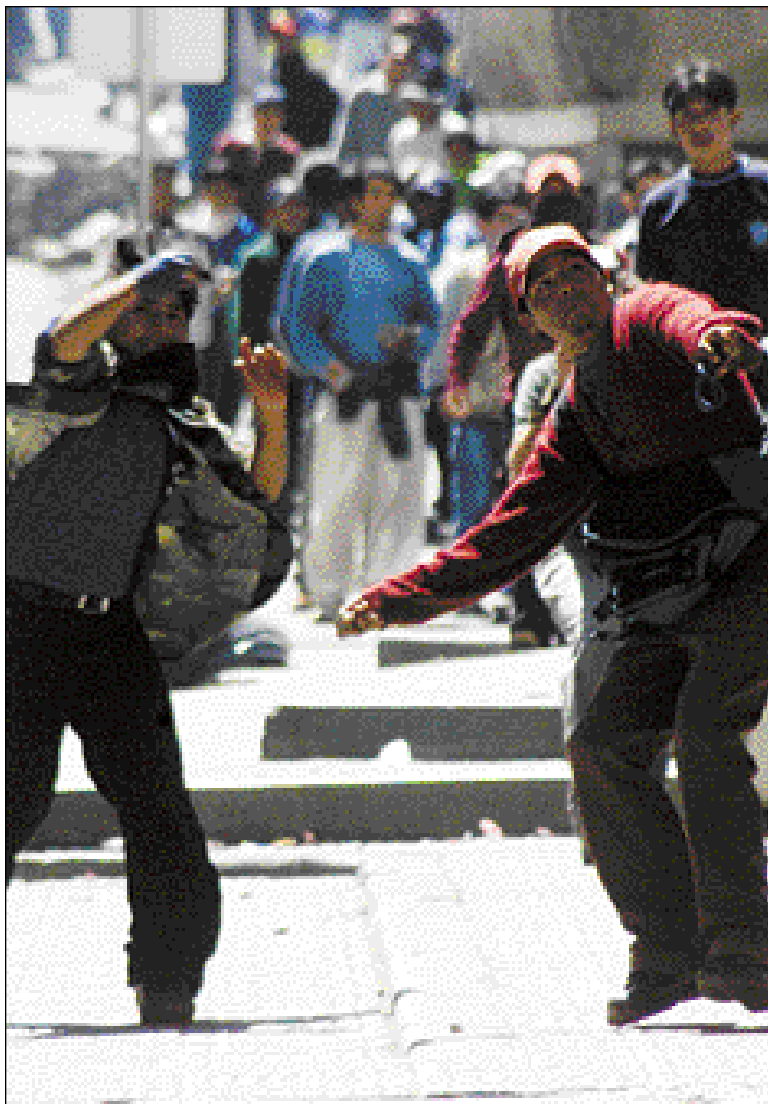
LA CALIFICACIÓN • Dos jóvenes lanzan piedras durante una represión policial. La percepción en el exterior fue negativa.

Mientras que el ministro de Asuntos Indígenas, Justo Seoane, indicó que el país revertirá esa calificación a través del diálogo entre el Gobierno y las organizaciones sociales a fin de atender las demandas. Las organizaciones sociales como la Central Obrera Boliviana y la Confederación Sindical Única de