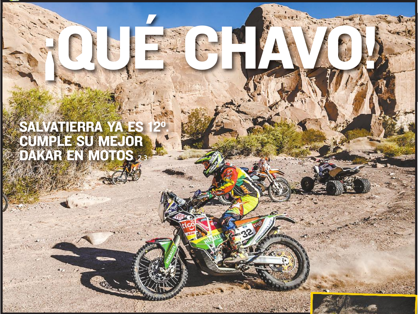
CHAVO SALVATIERRA RACING

SALVATIERRA YA ES 12º. CUMPLE SU MEJOR DAKAR EN MOTOS 2-3