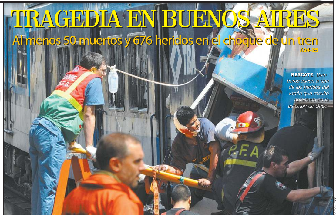
RESCATE. Bomberos sacan a uno de los heridos del vagón que resultó aplastado en la estación de Once.