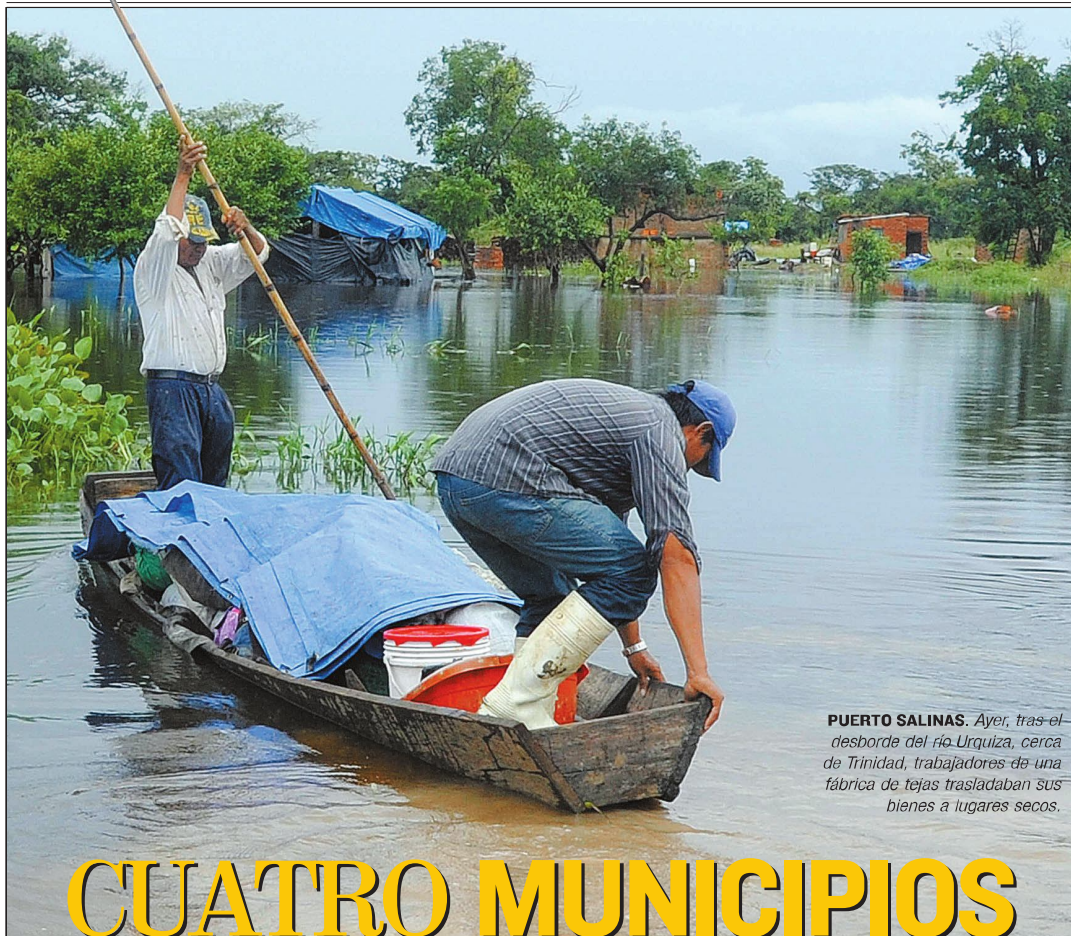
PUERTO SALINAS. Ayer, tras el desborde del río Urquiza, cerca de Trinidad, trabajadores de una fábrica de tejas trasladaban sus bienes a lugares secos.

200 PÁGS • 2 DE FEBRERO DE 2014 • N° 8.442 • PRECIO: LA PAZ Y EL RESTO DEL PAÍS BS 6 • DÓLAR VENTA BS 6.96