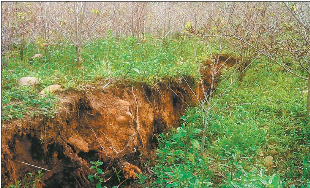
CONCEJO MUNICIPAL DE SHINAHOTA