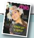
Los videos virales que conmueven en las redes. mia

El Gobierno aprueba el cierre del SUMI y el SPAM y da paso al Seguro Integral A22