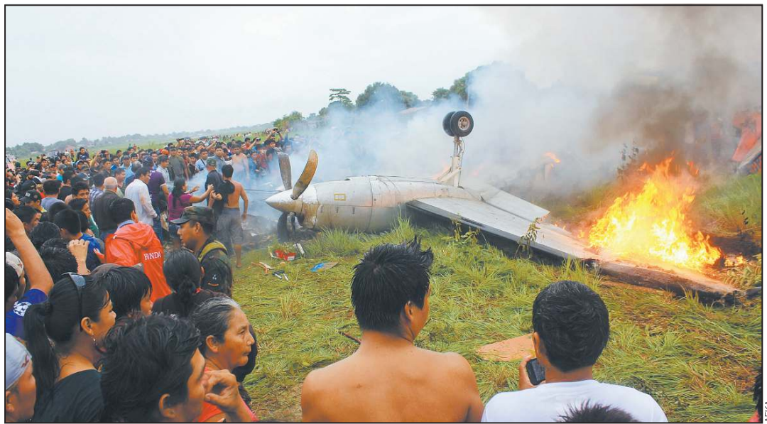
TRAGEDIA. El siniestro ocurrió a las 15.56; pobladores ayudaron a rescatar a las víctimas después que el avión se incendió y se salió de la pista.

Un avión de Aerocon sufrió el accidente al intentar aterrizar en Riberalta. Cadáveres quedaron carbonizados. Fallecieron tres funcionarios de la Gobernación beniana. A18-19