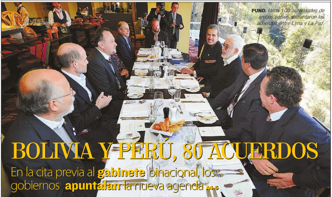
PUNO. Unas 100 autoridades de ambos países adelantaron los acuerdos entre Lima y La Paz.

■ A marzo, la última actualización del Índice Global de la Actividad Económica (IGAE), publicada en la página web del Instituto Nacional de Estadística (INE), registra un crecimiento de la economía en 5,15%, 15 décimas por encima de la proyección del Gobierno para este 2015. La previsión previa fue de 5,9%, desestimada el 11 de marzo. A8