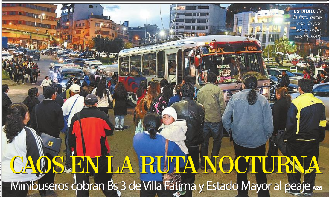
ESTADIO. En la foto, decenas de personas esperan minibús.

Chumacero no asistirá al llamado de la Verde MARCAS