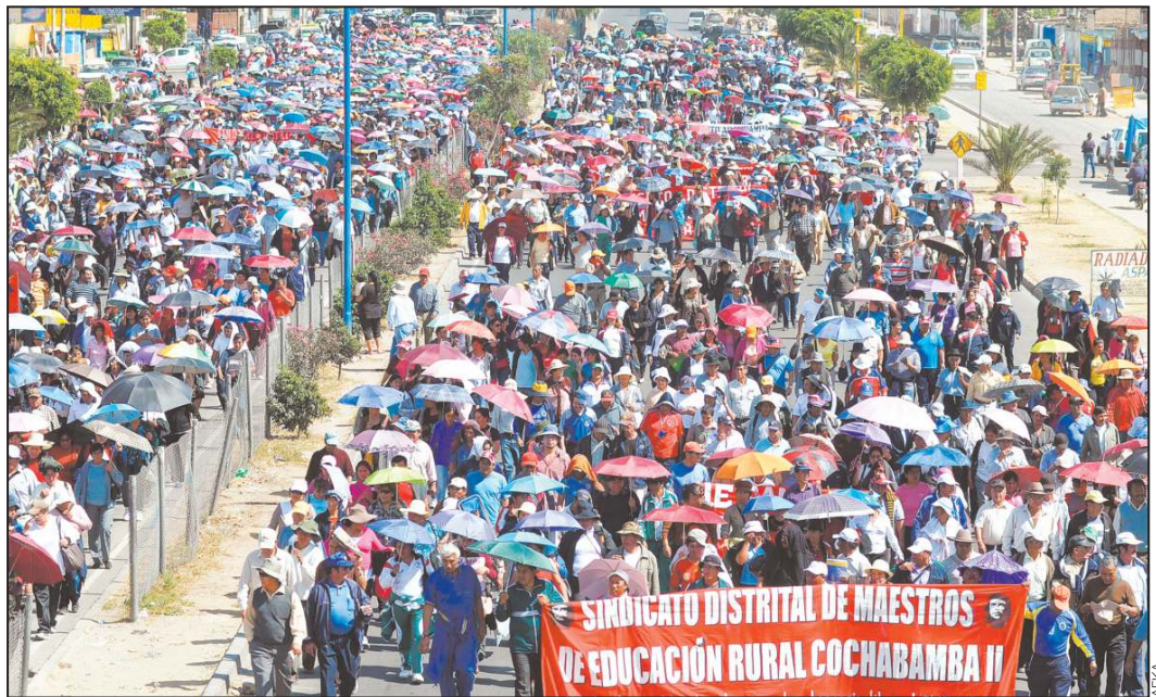
PARO. Maestros cochabambinos protagonizaron una caminata desde Quillacollo. En Santa Cruz y La Paz fueron suspendidas las clases.

Hubo marchas de sectores afines en La Paz, Santa Cruz, Cochabamba, Sucre y Potosí