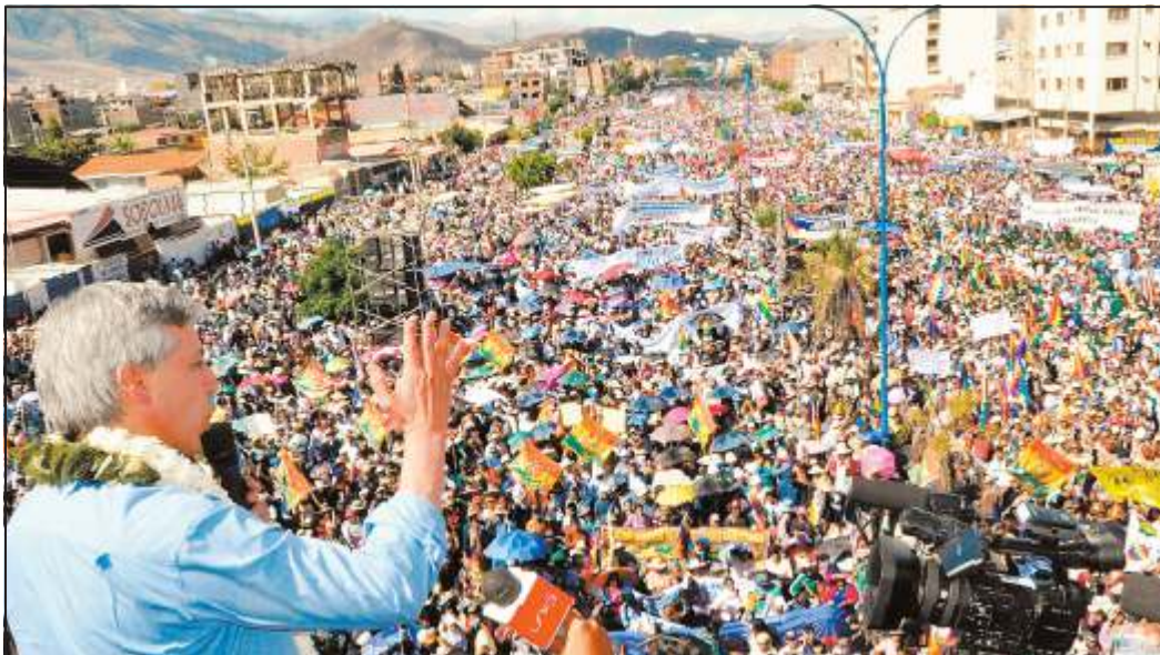
COCHABAMBA. La avenida Blanco Galindo se llenó de sectores sociales que dieron su apoyo al Gobierno. El vicepresidente García discursó.