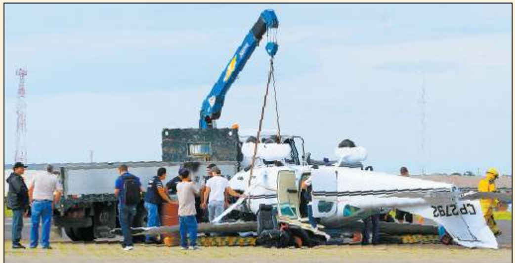
Una avioneta se rinde ante fuertes vientos. La madrugada de ayer, una nave (foto) fue volteada por el fenómeno en Santa Cruz. El temporal se produjo también en Beni, donde dejó varias casas destrozadas y árboles caídos. A17

■ Con el argumento de que el Censo 2012 redujo la población de la ciudad de La Paz, organizaciones aliadas del Movimiento Sin Miedo (MSM) impulsan la medida. Los partidarios del Movimiento Al Socialismo (MAS) cuestionan la protesta. Educación decide hoy si hay clases. A4