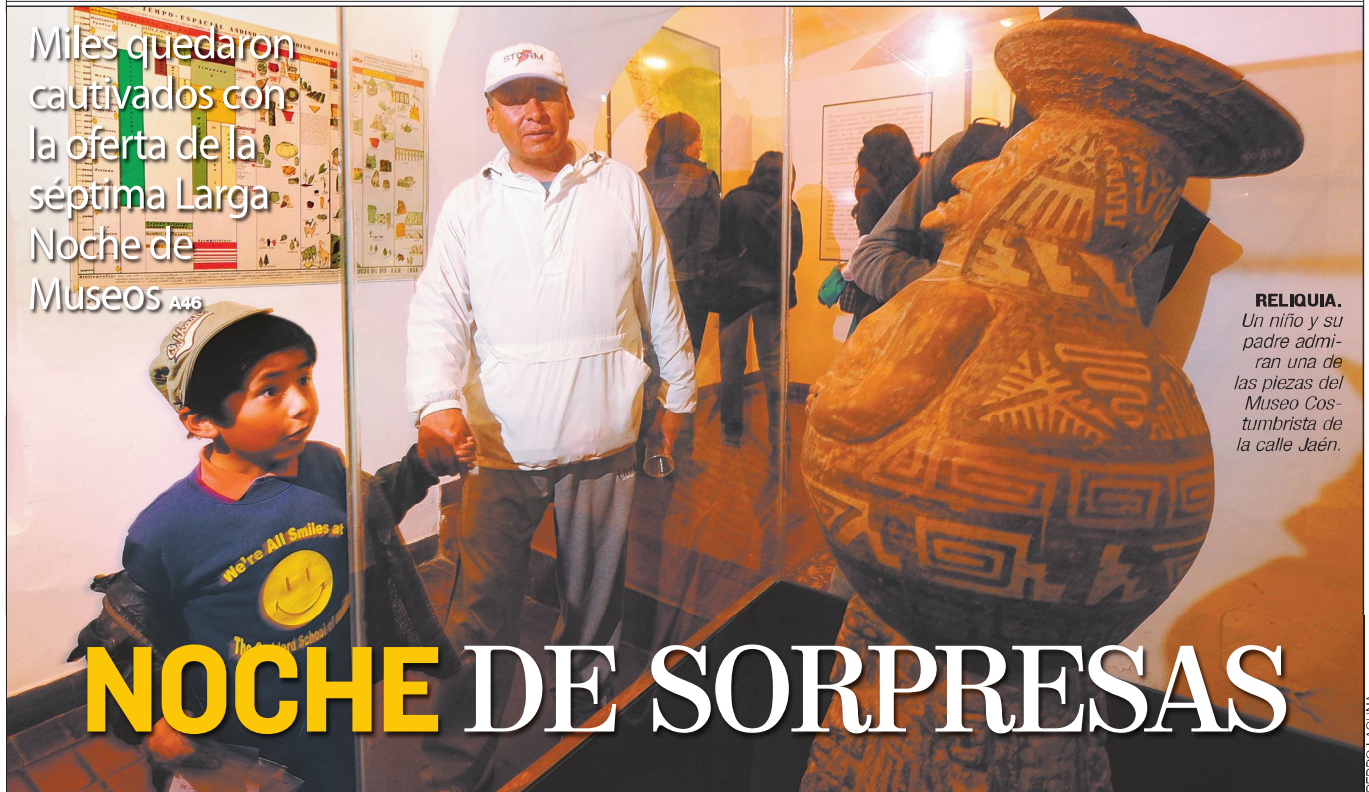
RELIQUIA. Un niño y su padre admiran una de las piezas del Museo Costumbrista de la calle Jaén.

Miles quedaron cautivados con la oferta de la séptima Larga Noche de Museos A46