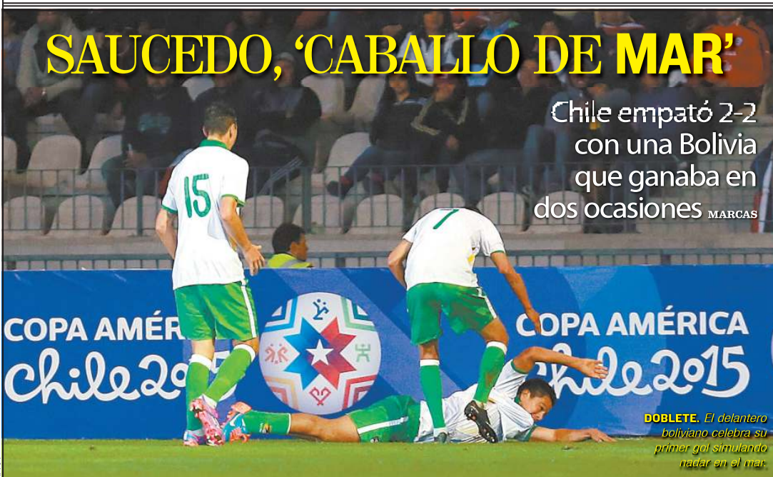
DOBLETE. El delantero boliviano celebra su primer gol simulando nadar en el mar.

Chile empató 2-2 con una Bolivia que ganaba en dos ocasiones MARCAS