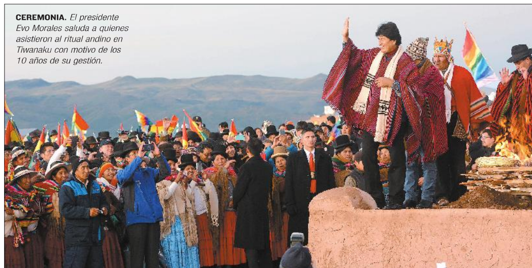
CEREMONIA. El presidente Evo Morales saluda a quienes asistieron al ritual andino en Tiwanaku con motivo de los 10 años de su gestión.

El Defensor detecta 12 trabas en el acceso al SIS