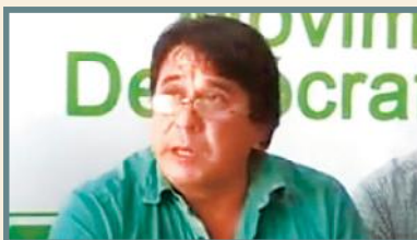
CAPTURA DE YOUTUBE

El Gobernador del Beni divulga encuesta en favor de Suárez; hay polémica