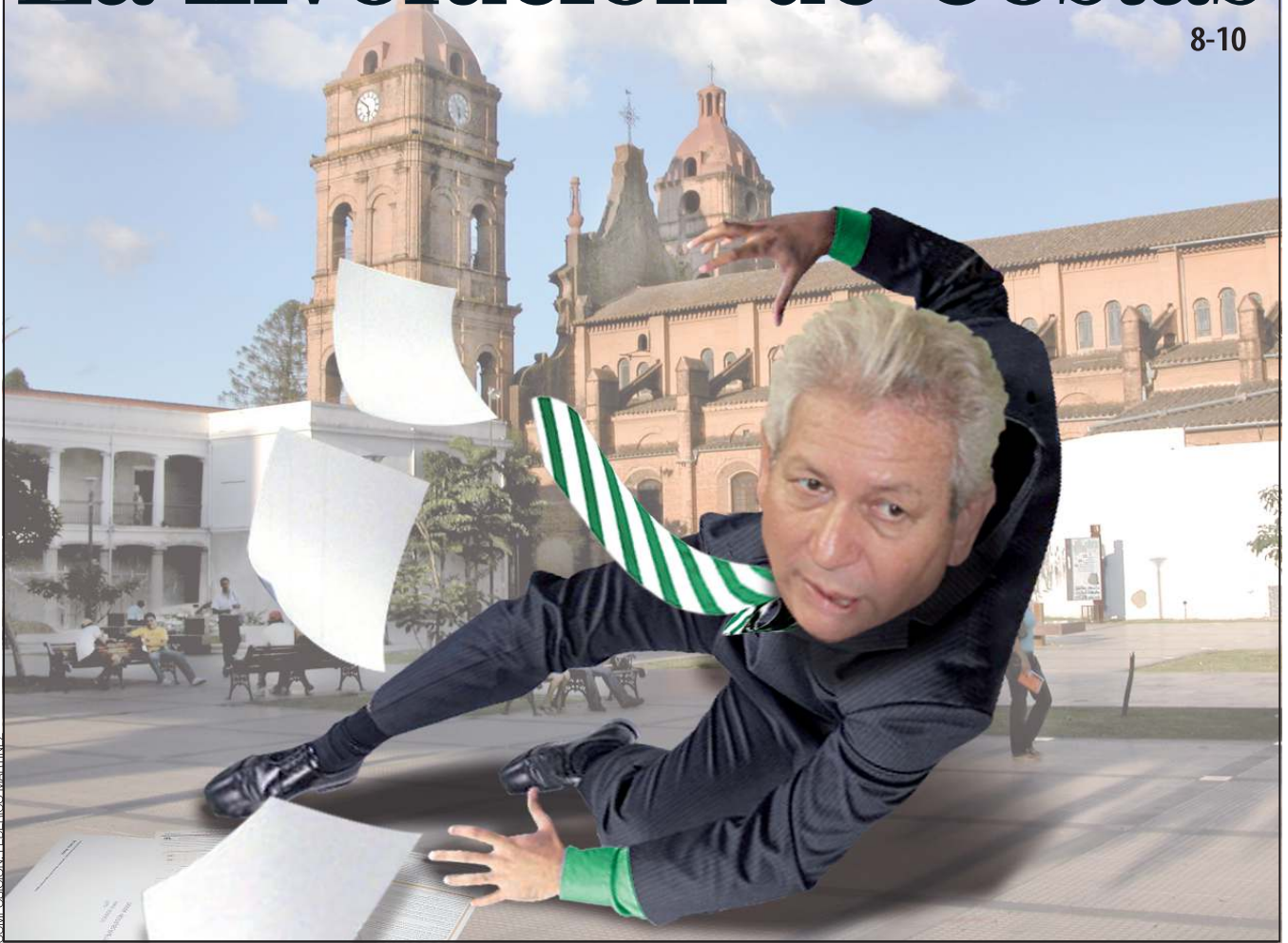
COMPOSICIÓN: FEDERICO MARTÍNEZ