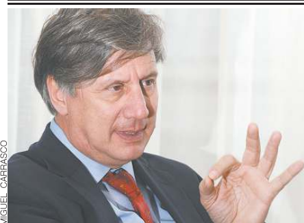
ILUSTRACIÓN: FERRICCO MARTINEZ