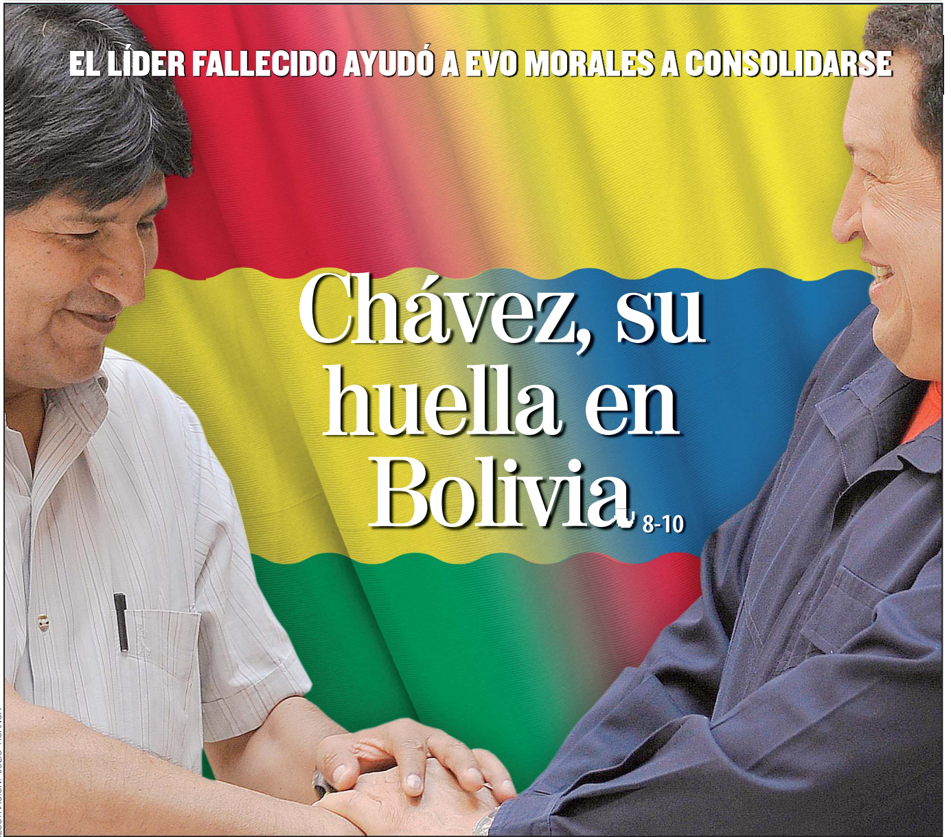
ILUSTRACIÓN: JULIO HUANCA