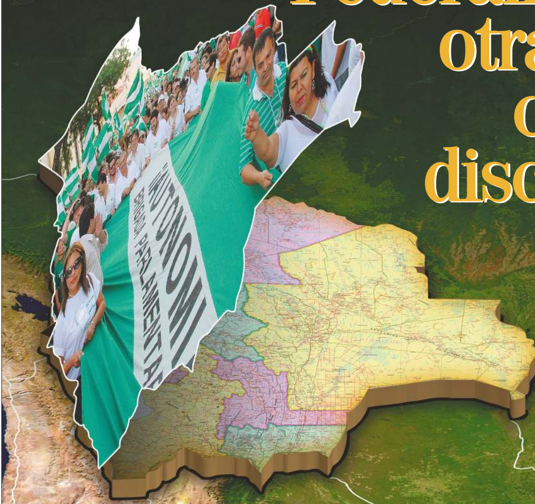
ILUSTRACIÓN: JULIO HUANCA

‘Voy a ser candidata presidencial para 2014’ 4-5