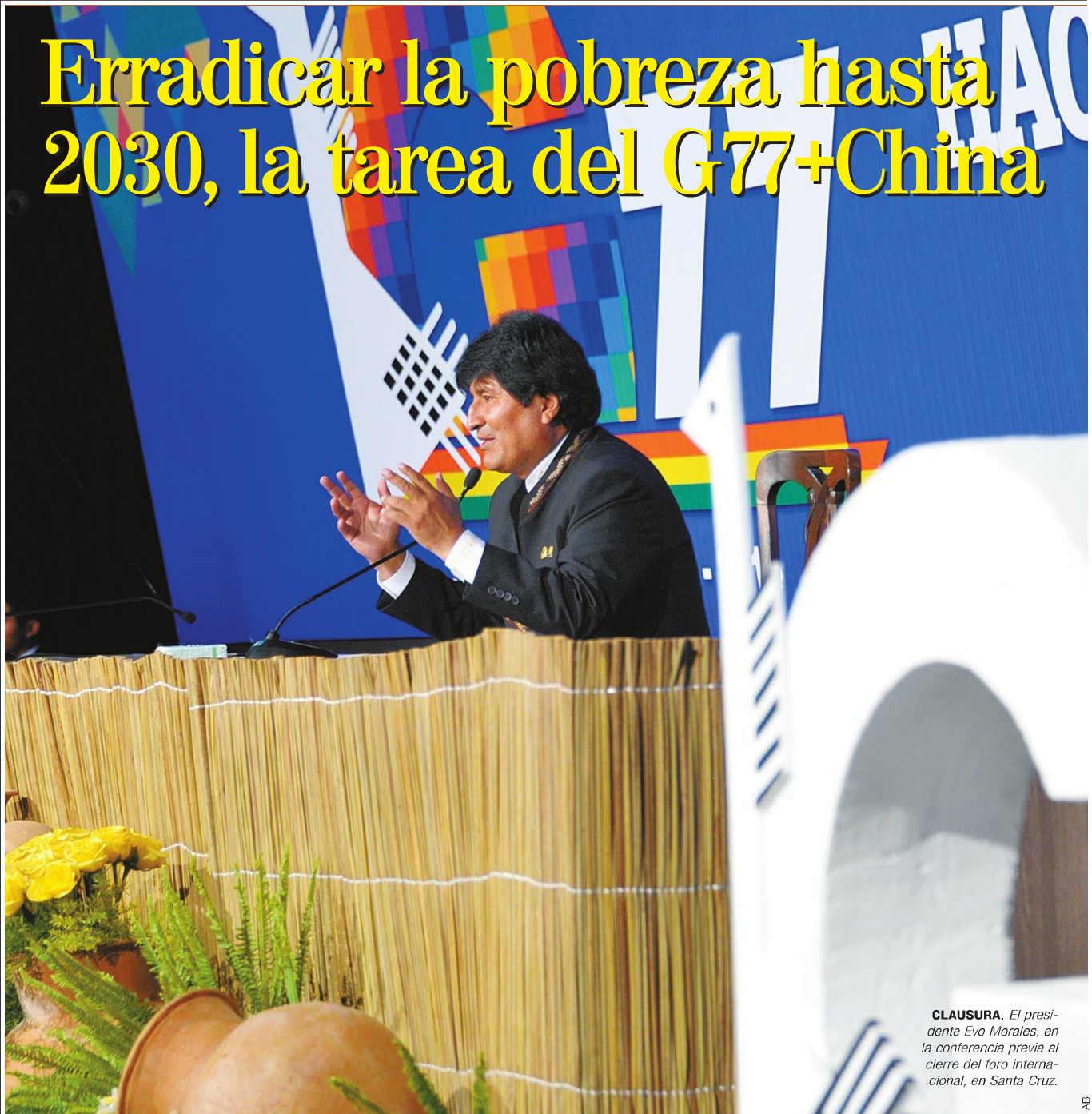
CLAUSURA. El presidente Evo Morales, en la conferencia previa al cierre del foro internacional, en Santa Cruz.

Erradicar la pobreza hasta 2030, la tarea del G77+China