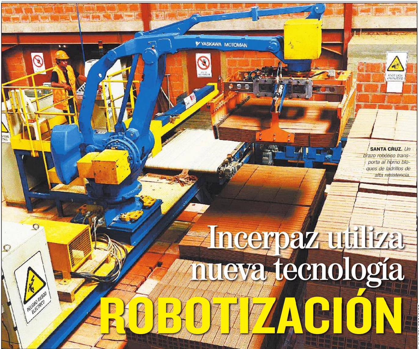
SANTA CRUZ. Un brazo robótico transporta al horno bloques de ladrillos de alta resistencia.