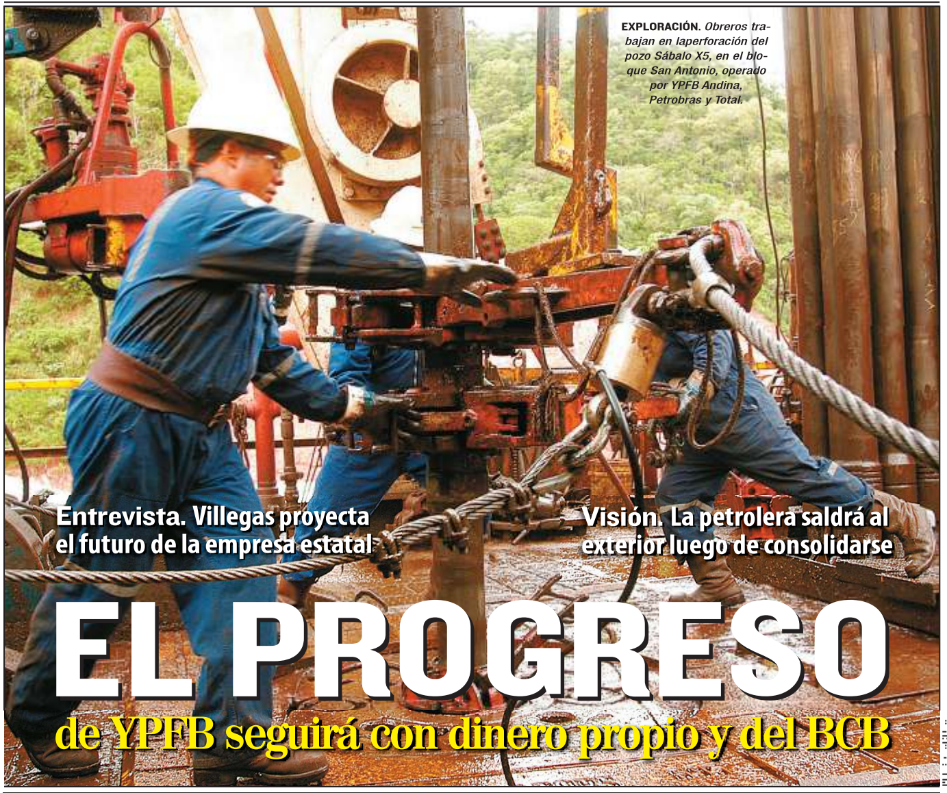
EXPLORACIÓN. Obreros trabajan en la perforación del pozo Sábalo X5, en el bloque San Antonio, operado por YPFB Andina, Petrobras y Total.

Entrevista. Villegas proyecta el futuro de la empresa estatal