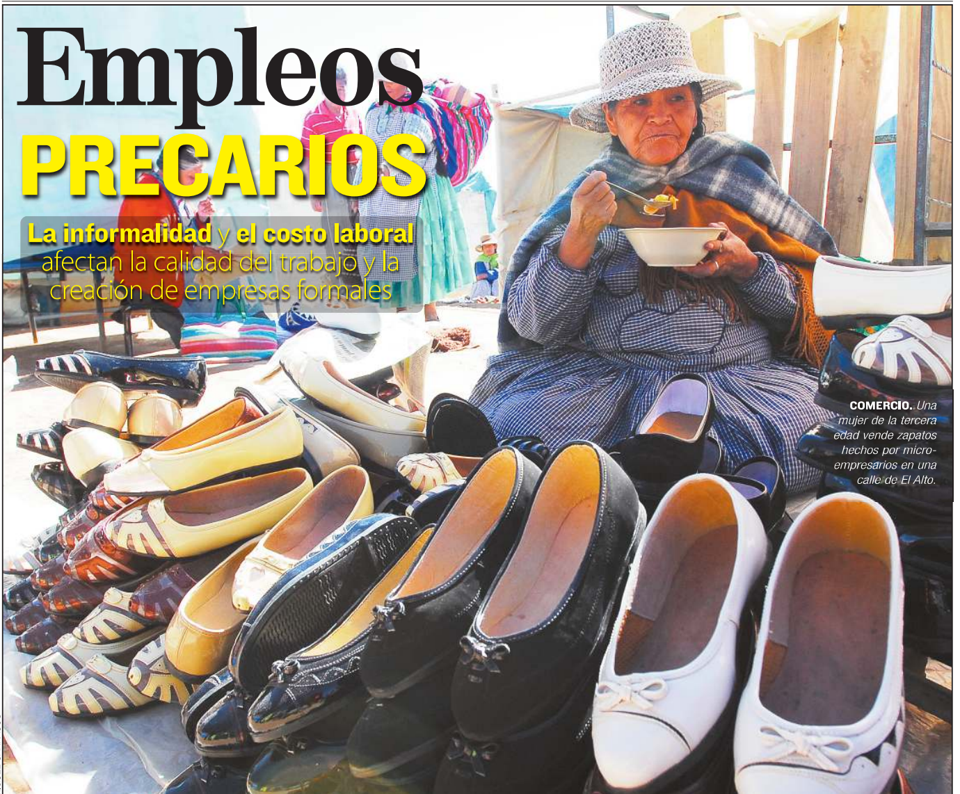
COMERCIO. Una mujer de la tercera edad vende zapatos hechos por microempresarios en una calle de El Alto.

La informalidad y el costo laboral afectan la calidad del trabajo y la creación de empresas formales