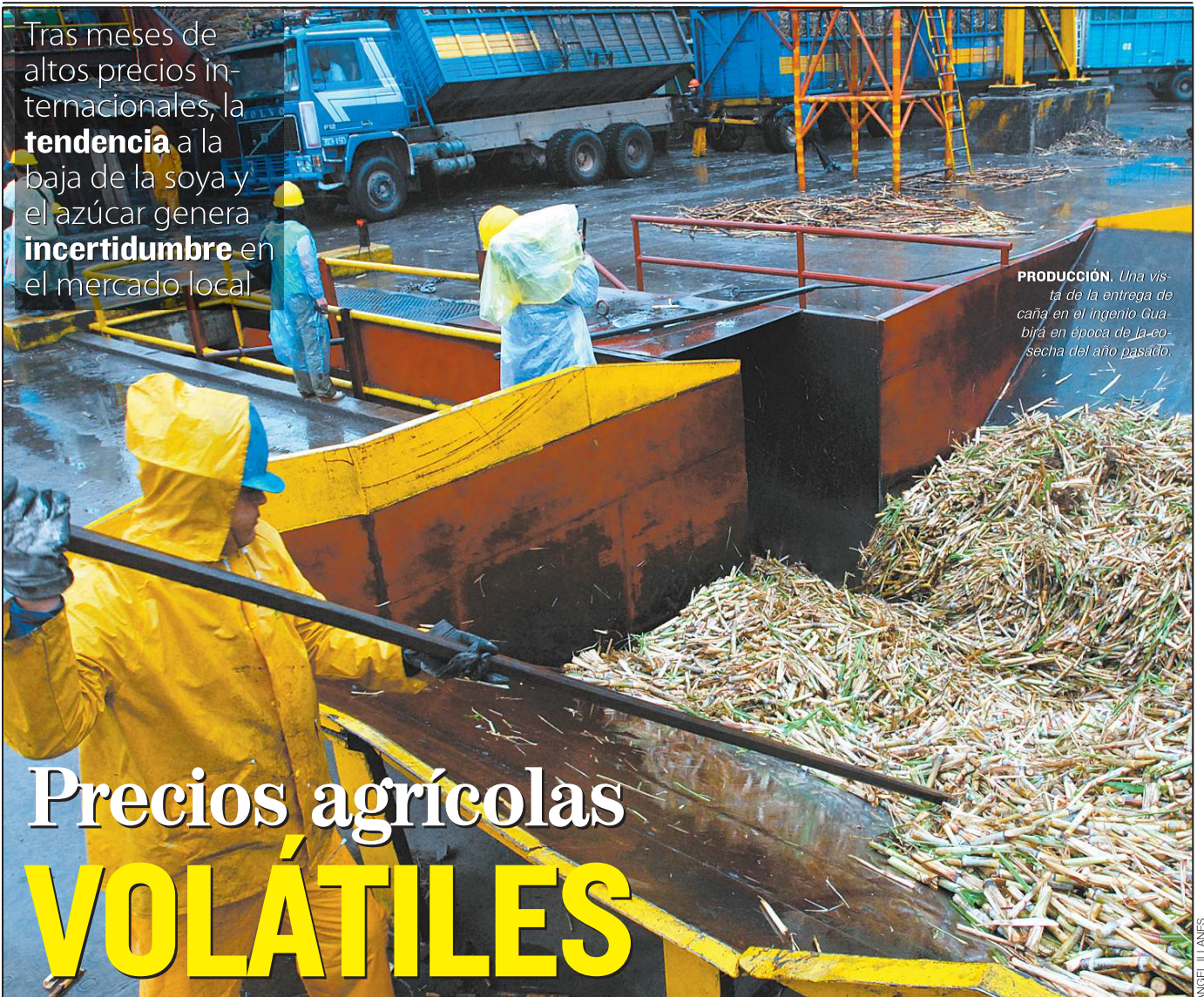
PRODUCCIÓN. Una vista de la entrega de caña en el ingenio Guabirá en época de la cosecha del año pasado.

Tras meses de altos precios internacionales, la tendencia a la baja de la soya y el azúcar genera incertidumbre en el mercado local