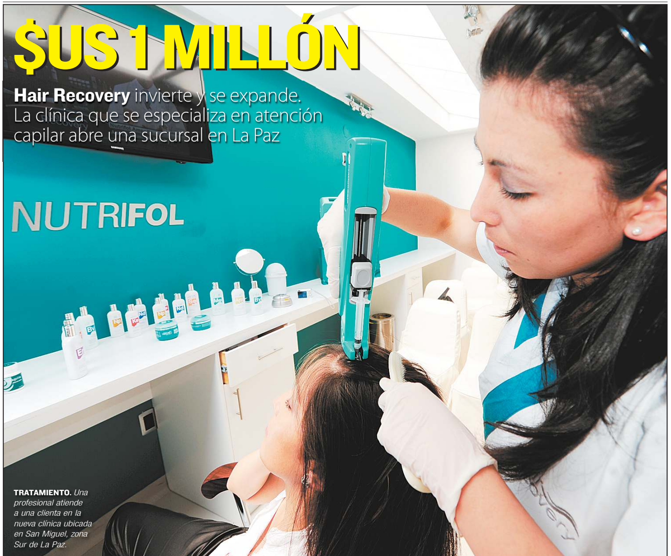
TRATAMIENTO. Una profesional atiende a una cliente en la nueva clínica ubicada en San Miguel, zona Sur de La Paz.