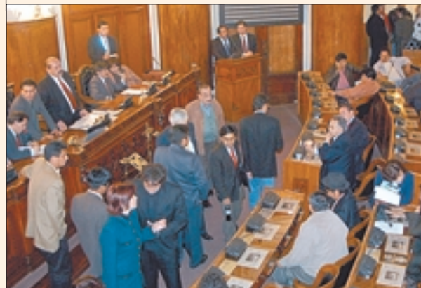
HISTÓRICO • El Congreso se puso de acuerdo.