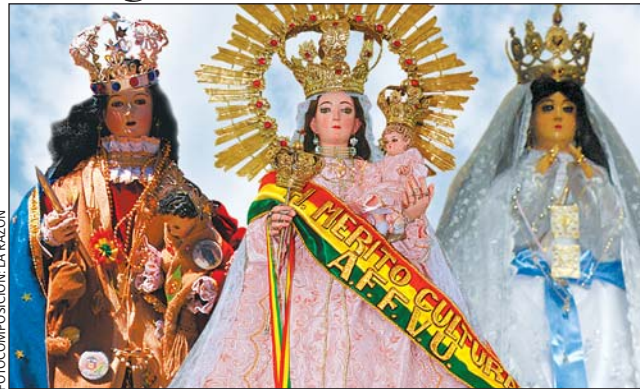
FOTOCOMPOSICIÓN: LA RAZÓN