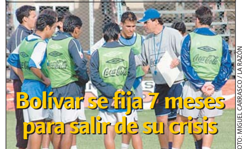
Bolívar se fija 7 meses para salir de su crisis