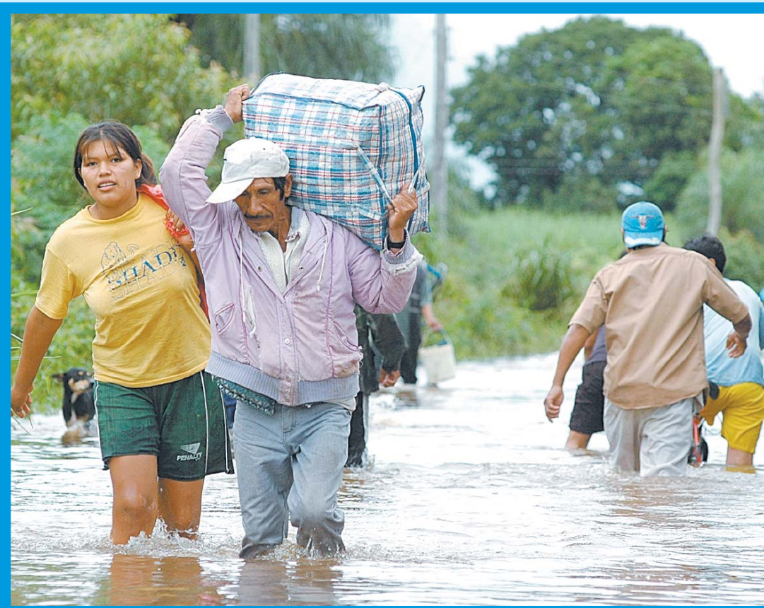
DAMNIFICADOS • Pobladores de El Porvenir, en Yapacaní, recuperan sus escasos bienes.

■ El Niño llegó con tormentas, sequías y nieve.