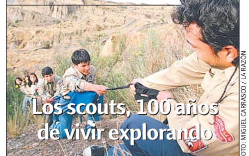
Los scouts, 100 años de vivir explorando