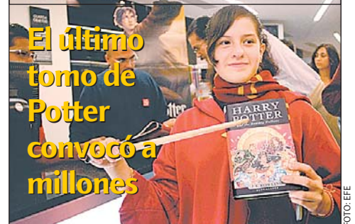
El último tomo de Potter convocó a millones