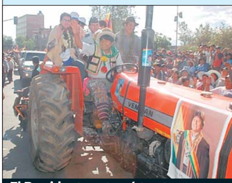
El Presidente entregó tractores ayer.