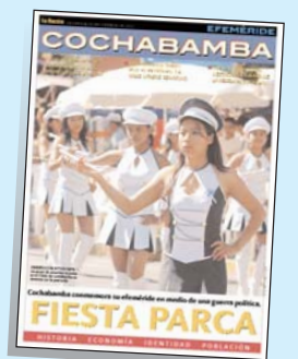
Desfile cívico • Un grupo desfila con la bandera del valle.

■ Especial. La Razón le regala una lámina didáctica y un suplemento de 12 páginas.