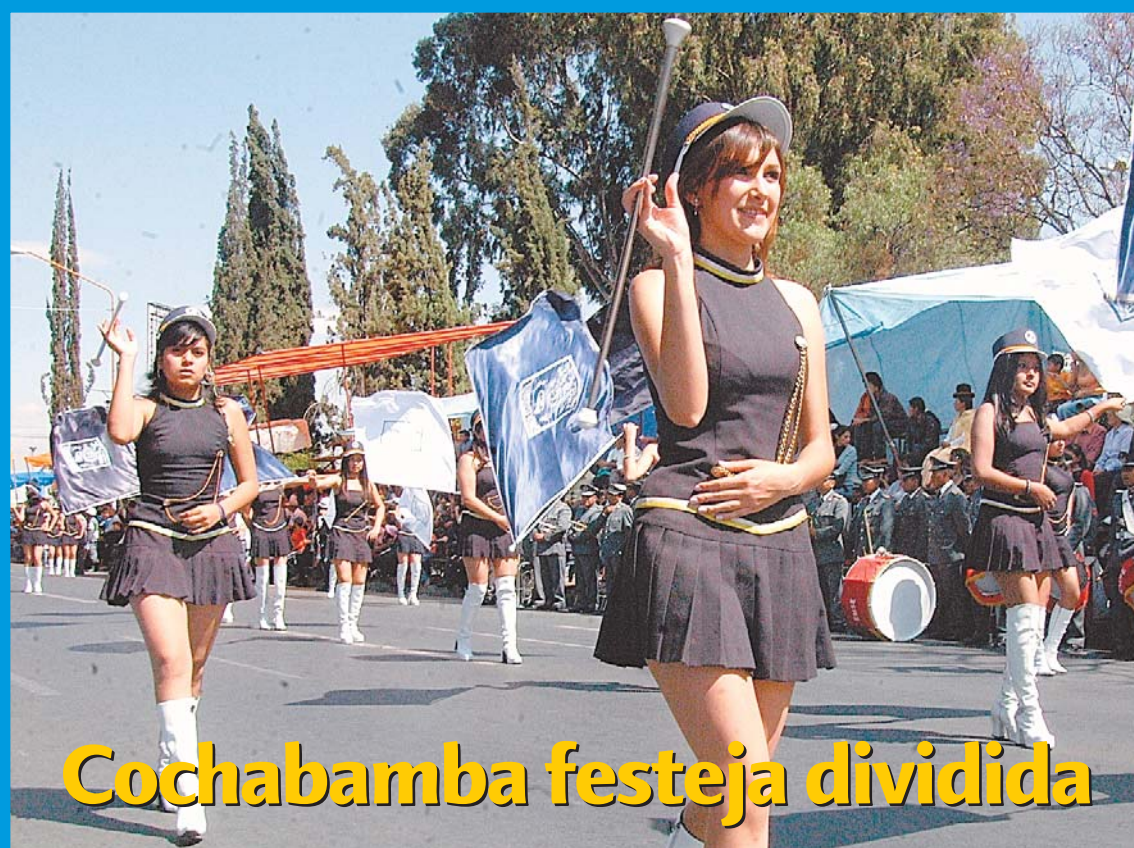
Cochabamba festeja dividida