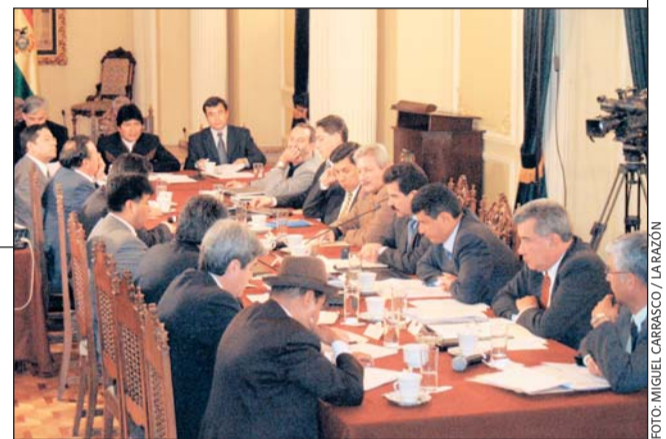
FRENTE A FRENTE • Los prefectos y el Gobierno iniciaron el diálogo en el Palacio de Gobierno ayer.

En la reunión primó el respeto y un grupo hostigó desde la calle.