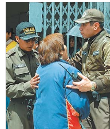
EN LA PAZ • La mujer quería entrar a comprar el arroz.

La importación de productos se amplió un año.