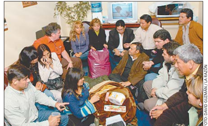
LISTOS PARA QUEDARSE • Opositores llegaron con enseres personales anoche al hemicycle.

Los opositores se instalan con frazadas y comida en el Parlamento.